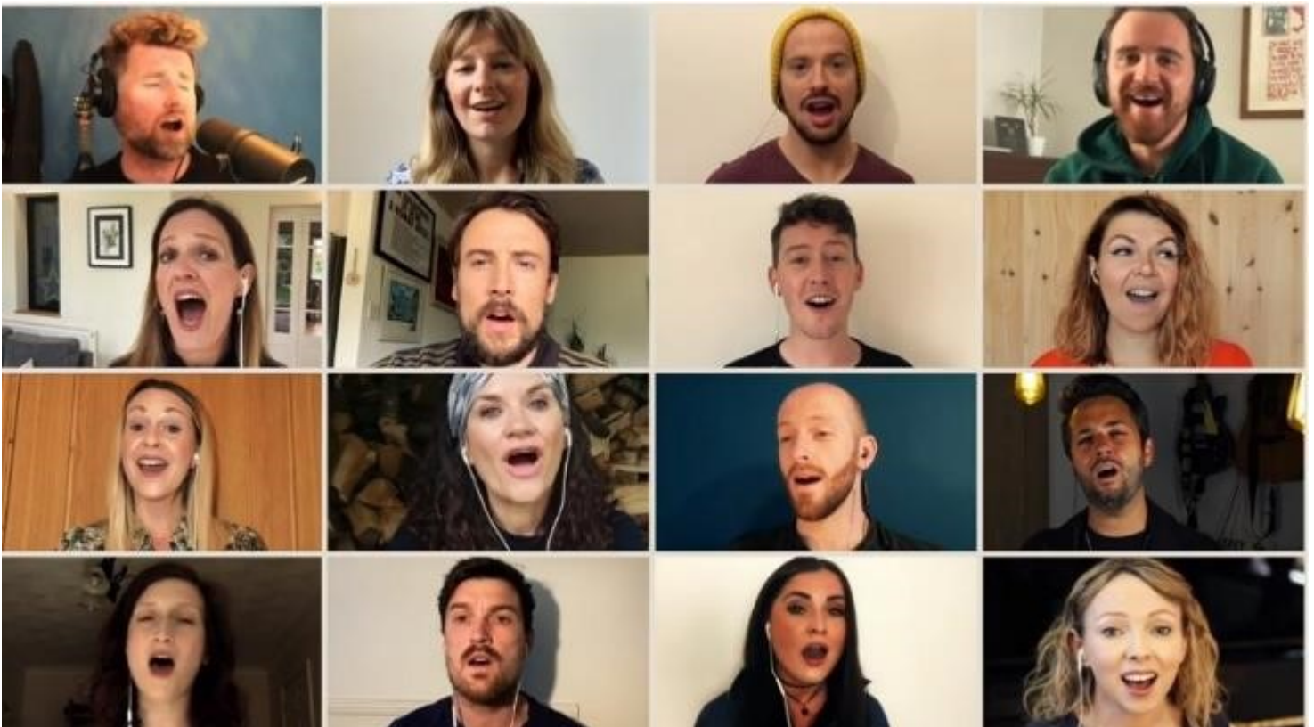
Cast gwreiddiol Deffro'r Gwanwyn, yn canu Hiraeth Haf

'Cei godi'n uwch, cei deimlo'n well Os oes gen ti gân i'w rhoi'.