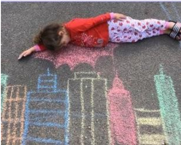
'Owelette', uwcharwr Lillie