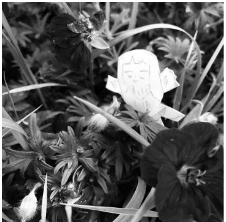
Llun ffug Nellie, wedi'i ysbrydoli gan dylwyth teg Cottingley