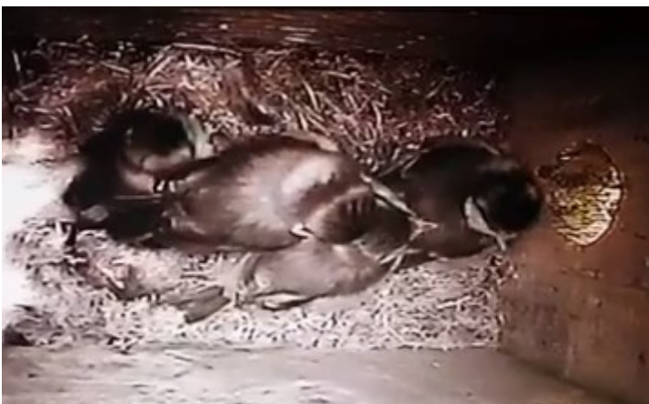
Bocs nythu'r ysgol – pedwar titw bach yn barod i adael y nyth. Mae'r bocs yn wag rŵan.