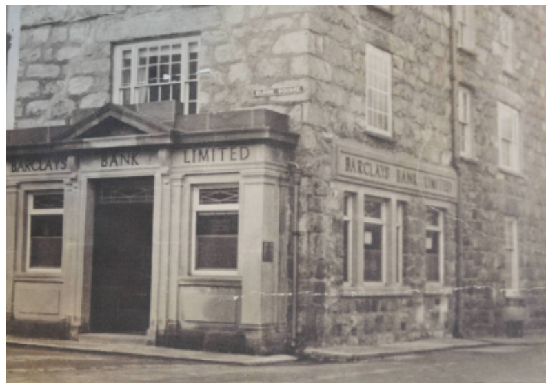
Tŷ Meirion - safle gwreiddiol y banc