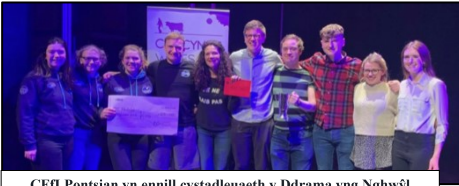
CFfl Pontsian yn ennill cystadleuaeth y Ddrama yng Nghwyl Adloniant CFfl Cymru.