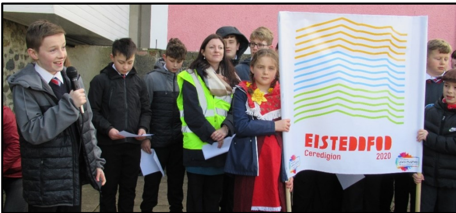
Gorymdaith Dydd Gwyl Dewi 2020 yn nhref Aberaeron