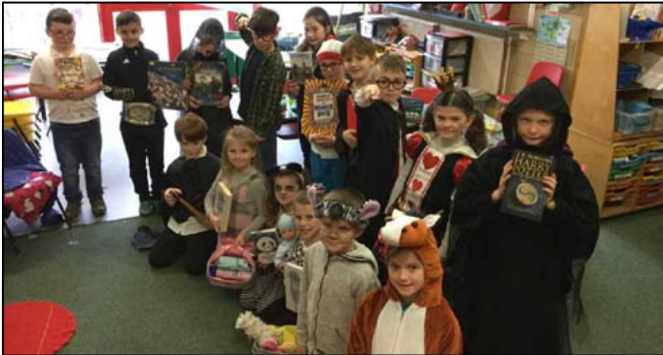
Uchod: Dosbarth Cwm-yr-Eglwys ac isod: Dosbarth Parrog