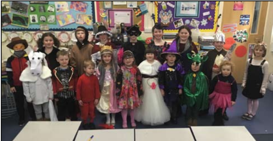
Y disgyblion wedi'u gwisgo fel cymeriadau o chwedlau ar Ddiwrnod y Llyfr.