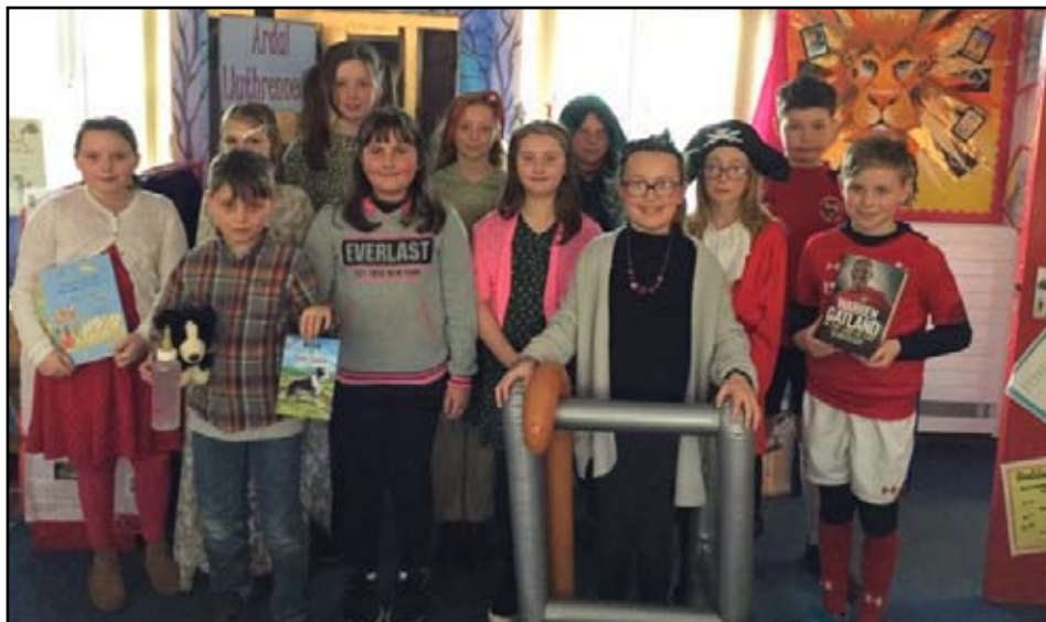
Ar Ddiwrnod y Llyfr fe wnaeth y disgyblion fwynhau gwisgo i fyny fel eu hoff gymeriadau o'r byd llenyddol.