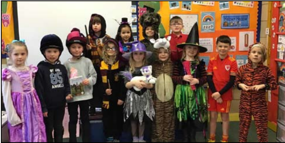
Uchod: Dosbarth y Betws ac isod: Dosbarth Pwllgwaelod