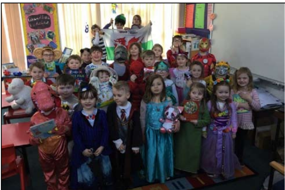
Beth am ddanfon newyddion eich ysgol CHI i'r Llien Gwyn