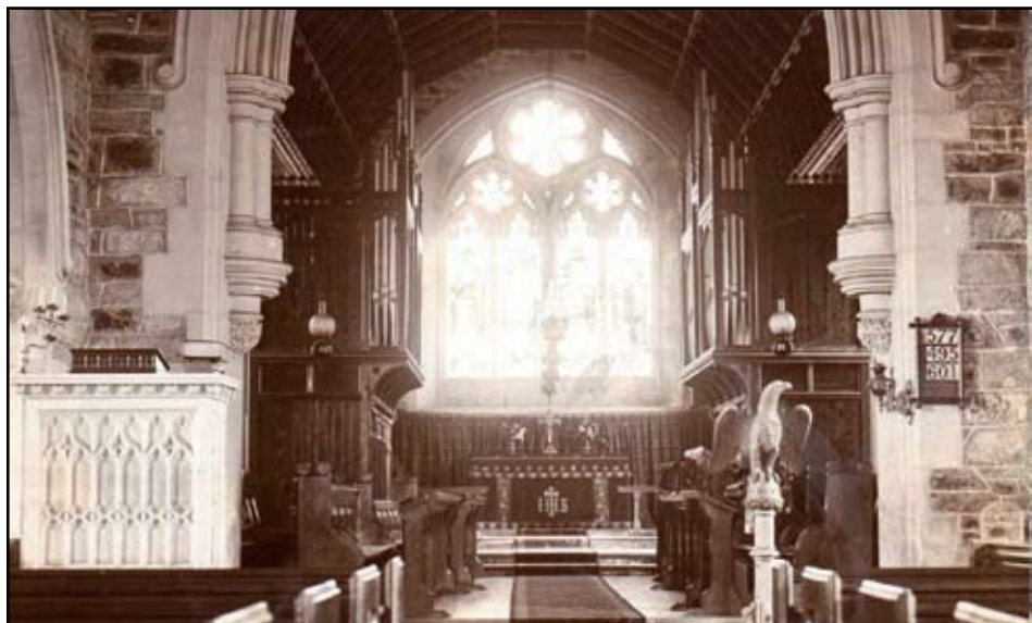
Tu fewn yr eglwys yn dangos safle blaenorol yr organ