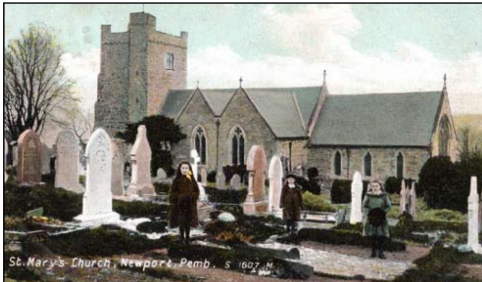
Eglwys y Santes Fair a'r Fynwent

Tan y flwyddyn 1689, roedd addoli tu allan i'r eglwys sefydlog yn rhywbeth anghyfreithlon. Yn y flwyddyn hon, fe basiwyd y Ddeddf Goddefgarwch, (the Toleration Act). Rhoddwyd caniatâd i'r anghydfurfwyr addoli tu allan i'r eglwys cyn belled fod y pwlpud ddim yn cael ei ddefnyddio i bregethu yn wleidyddol. Serch hyn, arhosodd y Methodistiaid, a