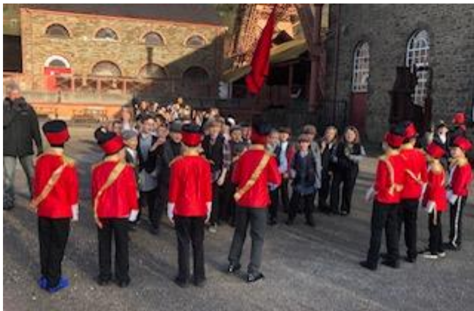
Ffilmio ym Mharc Treftadaeth y Rhondda