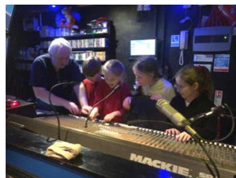
Dysgu am ochr dechnegol y sioe