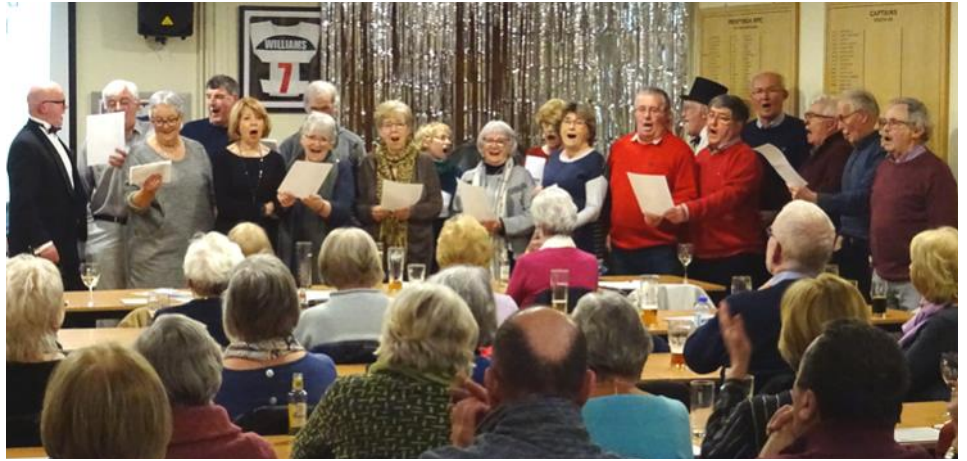
Y Côr yn cloi Rifiw Clwb y Dwrllyn

Un mil naw cant saith deg a naw Blwyddyn sy’n dal i godi braw Cofiwn am y refferendwm Pleidlais ‘Ie’ gafodd godwm.