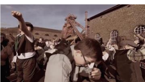
Lluniau o hysbyseb fideo sioe 'Glo'