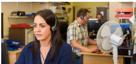
Canolfan Galw Shelter

Y rhif ffôn i gysylltu am gyngor arbenigol ar dai yw 0800495495 ac mae'r rhif ffôn ar gael 9.30yb tan 4yp dydd Llun i ddydd Gwener. Allwch hefyd cael cyngor ar lein ar ei wefan < https://sheltercymru.org.uk/get-advice/coronoavirus > a fydd y wefan yn cael ei diweddarau yn gyson.