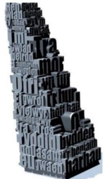
Geiriau'r anthem wedi'u cerfio

Erthygl o CwmNi, Papur Bro ardal Caerffili