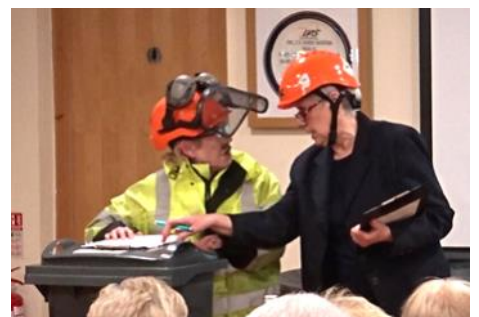
Bois y Bin yn Rifw Clwb y Dwrlyn

Yn y cyfnod anodd yma rhaid diolch i berchnogion siopau Pentyrch am eu gwaith caled yn ceisio cyflenwi ein anghenion bob dydd. Diolch hefyd i bawb sydd wedi doddi negeseuon drwy'r drysau yn datgan eu parodrwydd i helpu mewn unrhyw ffordd y medrant.