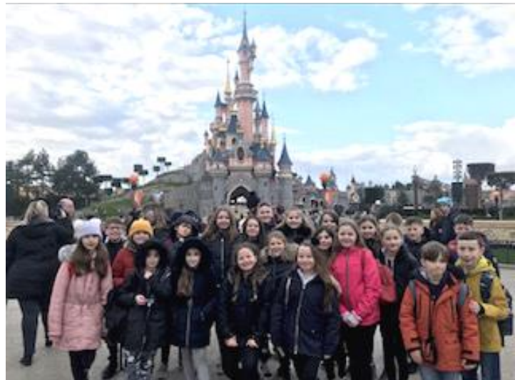
Taith i Wyl Gymreig Disney

Cafwyd 4 diwrnod bythgofiadwy yn Ffrainc pan aeth 23 o ddisgyblion blwyddyn 5 a 6 i ddathlu'r Wyl Gymreig yn Disney. Wrth gwrs, roedd digon o amser i fynd i gael hwyl yn y ffair, siopa a phrofi bwydydd mewn amrwyiol fwytai. Roedd y plant dipyn yn ddewrach na'r athrawon yn y ffair! Roedd y bws yn orlawn pan ddaethom adref, yn llawn tegau Disney!