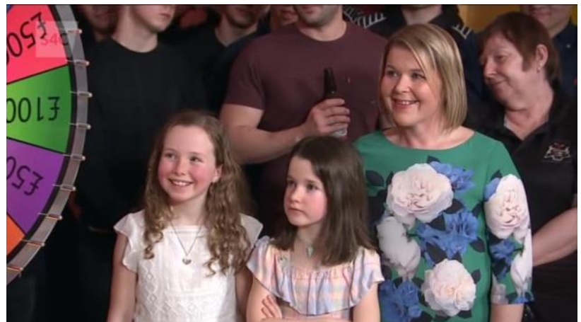
Efa gyda’i chwaer a’i Mam ar Heno nos Sadwrn o Bentyrch