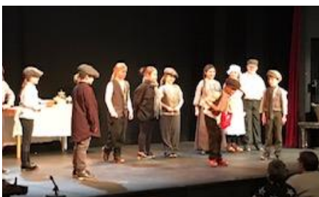
Closwyr Blwyddyn 4