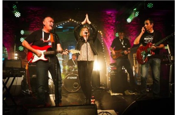
Catsgam yn y gig ym Mhorth