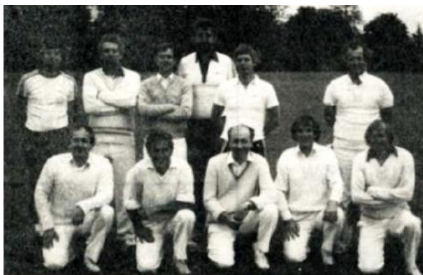
Tîm Criced Clwb y Dwrllyn 1985

Chwaraewyd pedair gêm yn ystod tymor 1985, ac o ystyried y glaw a gafwyd yr haf honno, fe lwyddwyd i gael nos lau sych bob tro.