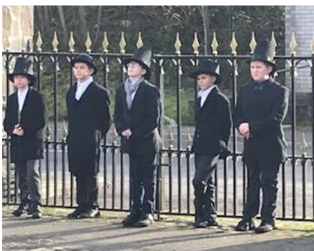
Aros i ffilmio golygfa