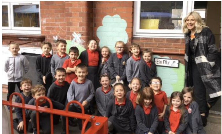
Dosbarth Elin Fflur

Ar Fawrth y 13eg cawsom syrpreis arbennig yn ystod ein gwasaeth dathlu. Daeth y gantores a'r gyflwynwraig, Elin Fflur i'r ysgol. Roedd wedi clywed bod dosbarth wedi'i enwi ar ei hôl ac felly roedd am ddod i gyfarch disgyblion